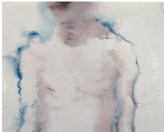
Philippe Cognée, Torse , 2000

▶ Atelier enfants pendant les vacances scolaires, dates à venir