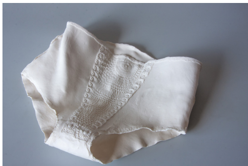
« Le dressing imaginaire », porcelaine 2013-2016