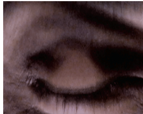
Éric Gossec, Si ton œil était plus aiguë . vidéo 3'25''