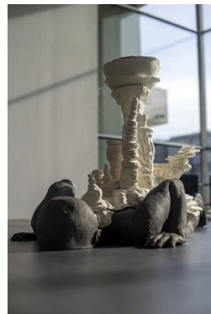
Élodie Lefebvre, Portare – 2021, Grès noir et porcelaine papier, 75 x 161 x 76 cm