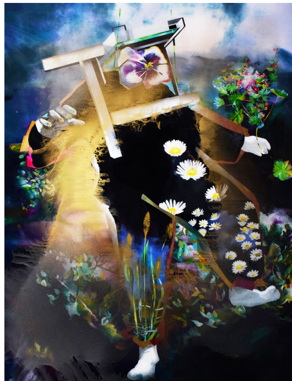
Muriel Rodolosse, Pensées sauvages , peinture inversée sous Plexiglas 130 x 100 cm, 2021 © Muriel Rodolosse