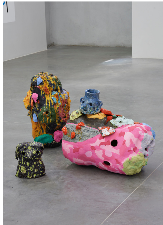
Vue d'exposition. Florent Dubois, La liberté des liaisons , 2017 Centre d'art contemporain les Capucins, Embrun