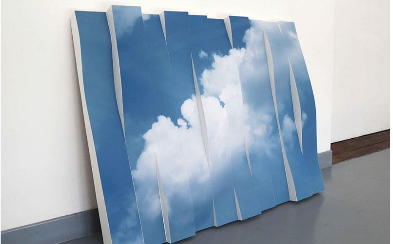
© Marc-Antoine Garnier, Nuage , 2020. photographie contrecollée sur volume, 105 x 120 x 15 cm